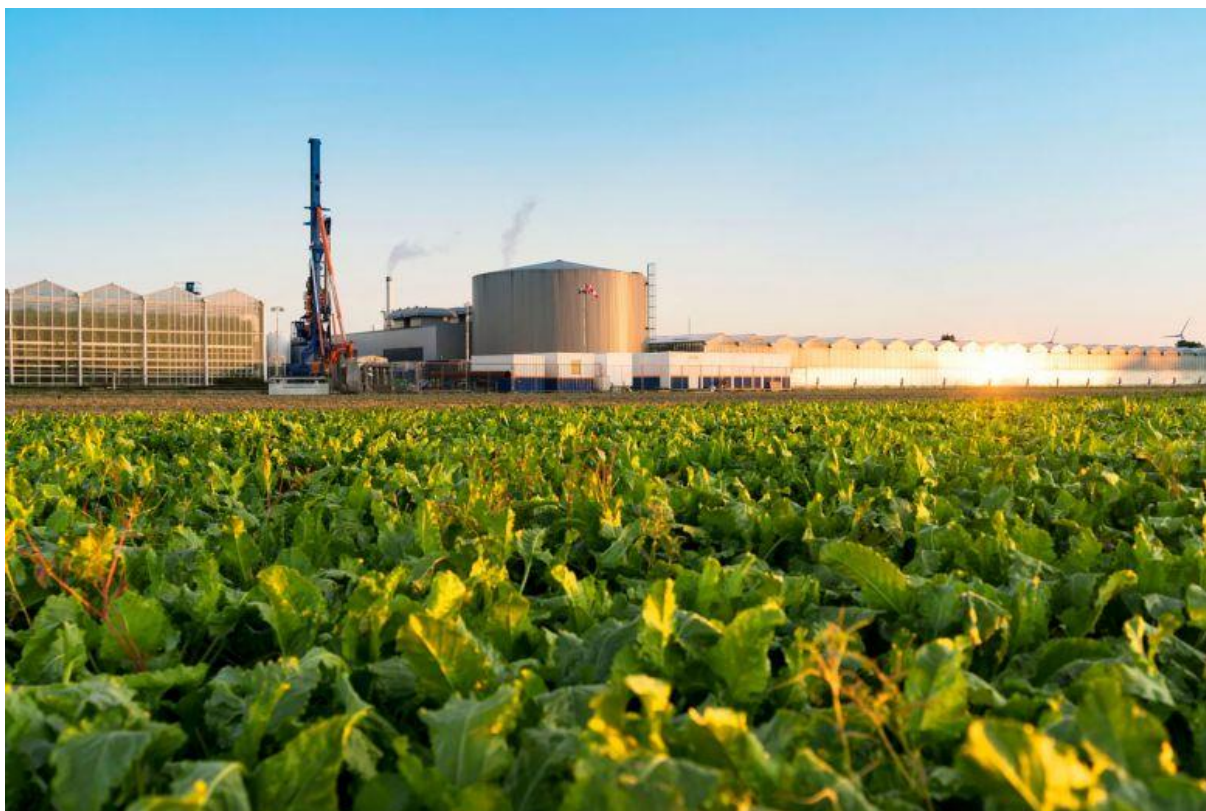
Boren naar lage temperatuur aardwarmte voor GreenBrothers in Zevenbergen